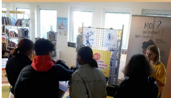
Stand d'information TABADO au lycée Jean Lurçat à Fleury-les-Aubrais

Pistes vainqueur des Tabado Games 2020/2021 avec le lycée professionnel agricole de Beaune la Rolande